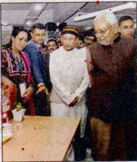
CM Nitish Kumar at 'B-Hub'

Nitish spoke to entrepreneurs and enquired about the works being done by them